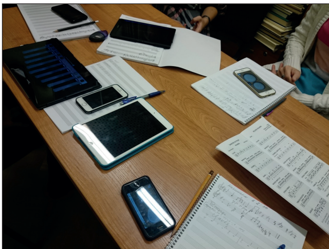
Илл. 5. Этнические инструменты из ритмической партитуры (лежит рядом на фото) на студенческих планшетах и смартфонах

мелодии и ритмы других национальных музыкальных языков учащиеся знакомятся и интонационно «принимают в себя» элементы новых для них культур, приучаются относиться к ним с должным вниманием и уважением. И все это мы можем сделать, не выводя учащегося за пределы привычного ему сегодня цифрового мира.