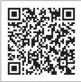
Илл. 3. Ссылка на видеозапись.