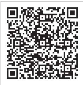
Илл. 4. Ссылка на видеозапись.

Еще больше возможностей перед педагогом открывает область мобильных приложений-симуляторов разнообразных этнических ударных инструментов. Среди них: различного строя и размера восточные барабанчики, калимбы , дарбуки , конгас-бонгос , разнообразные трещотки и даже коровий колокольчик. Все эти приложения, опять же, можно скачать бесплатно. (Единственное, надо учитывать, что в виртуальных магазинах типа Google Play эти приложения периодически выступают под видеоизменяющимися названиями).